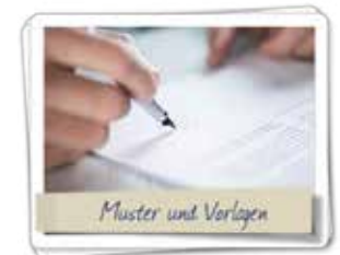
Vertragsmuster und Vorlagen