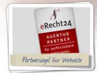
Partnersiegel für Ihre Website