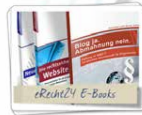
Alle eRecht24 E-Books