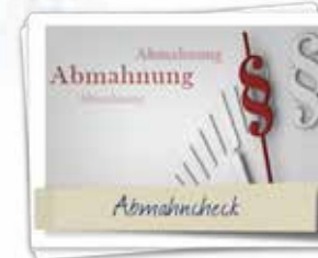
kostenloser Abmahncheck für Ihre Website