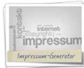
Impressum & Datenschutzgenerator