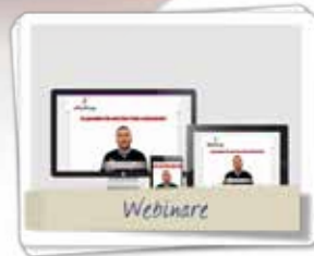
Aktuelle Live-Webinare zu Ihren Fragen